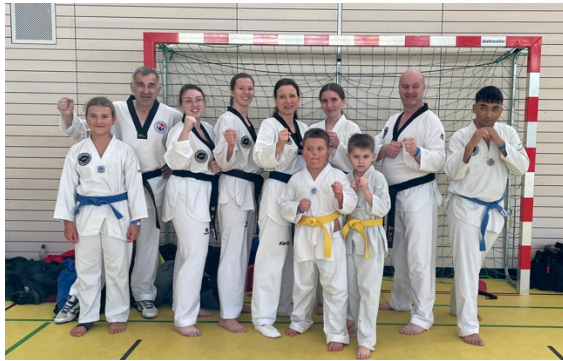
Erstmal ein kleines Gruppenfoto von uns