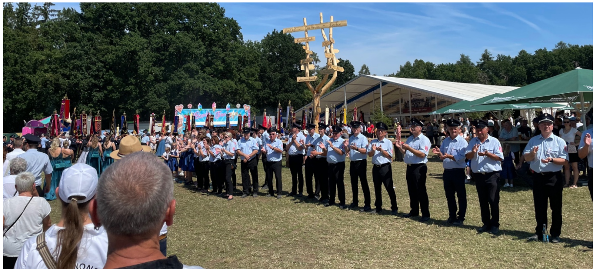
Ein schöner Empfang durch die FFW Kaspeltshub – ein wirklich gelungenes Fest