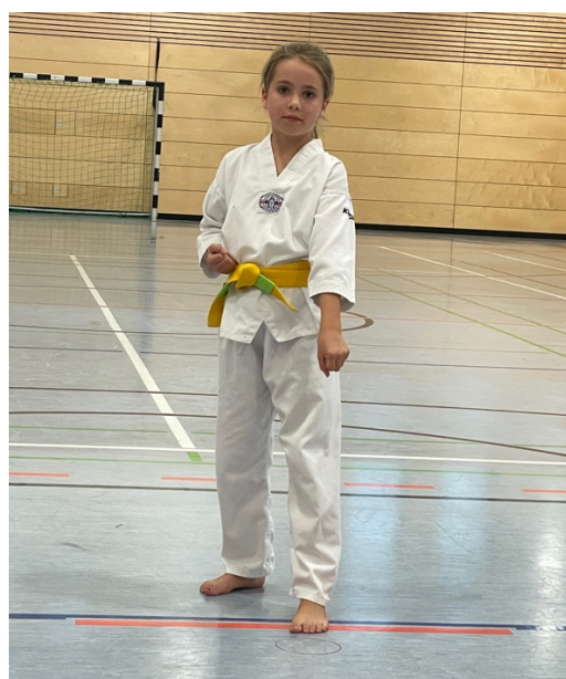
Abgesehen vom linken Daumen, kann man es gelten lassen