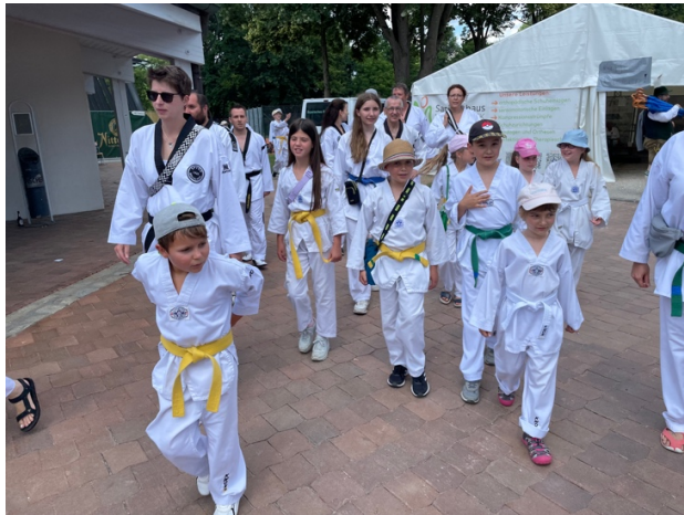
Wir sind bereit für den Festzug – ganz nette Truppe