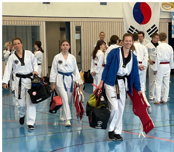
Einmarsch der Gladiatoren