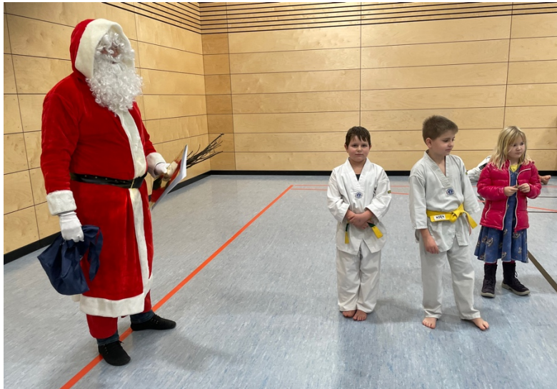
Die mit der roten Jacke hat sich reingeschlichen