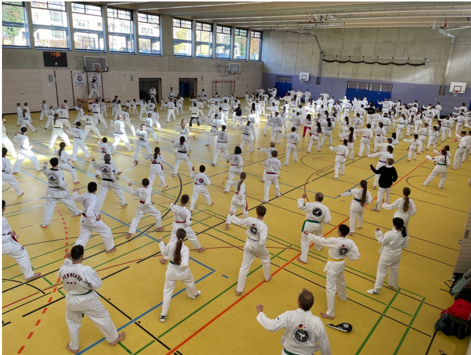
Mal ein Blick von oben auf das Geschehen