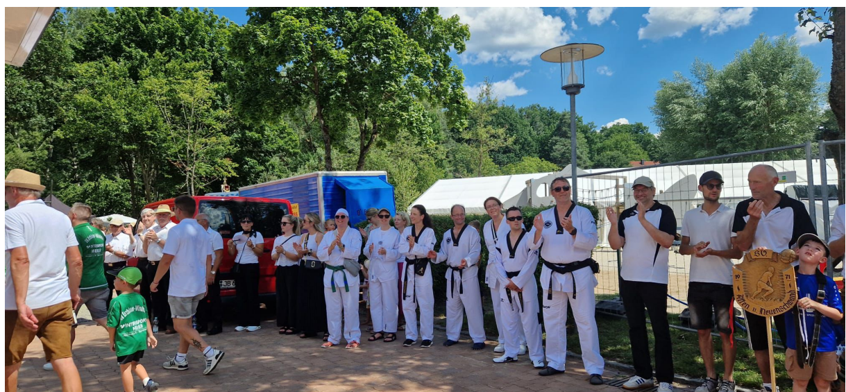
Und am Ende dürfen wir alle Teilnehmer der anderen Vereine begrüßen – schön war`s!