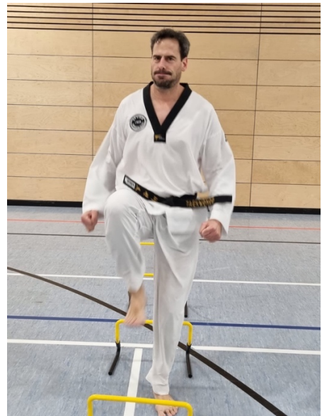
Roman wird doch nicht die Puste ausgehen