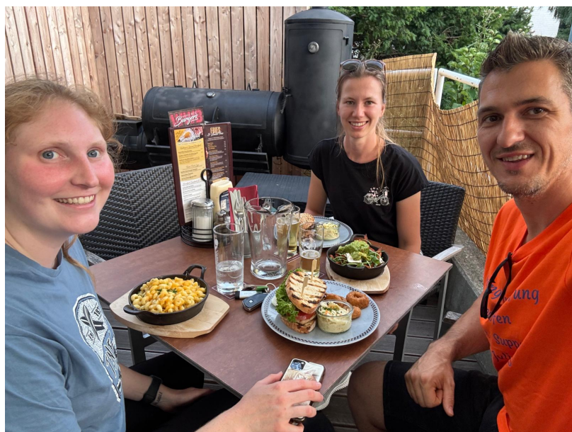
Ein kleines Häppchen haben wir uns jetzt echt verdient!