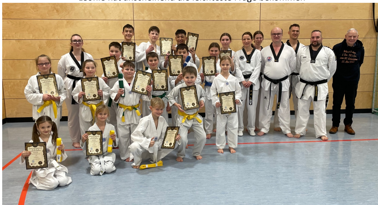
Es ist geschafft – Gruppenbild nach bestandener Prüfung