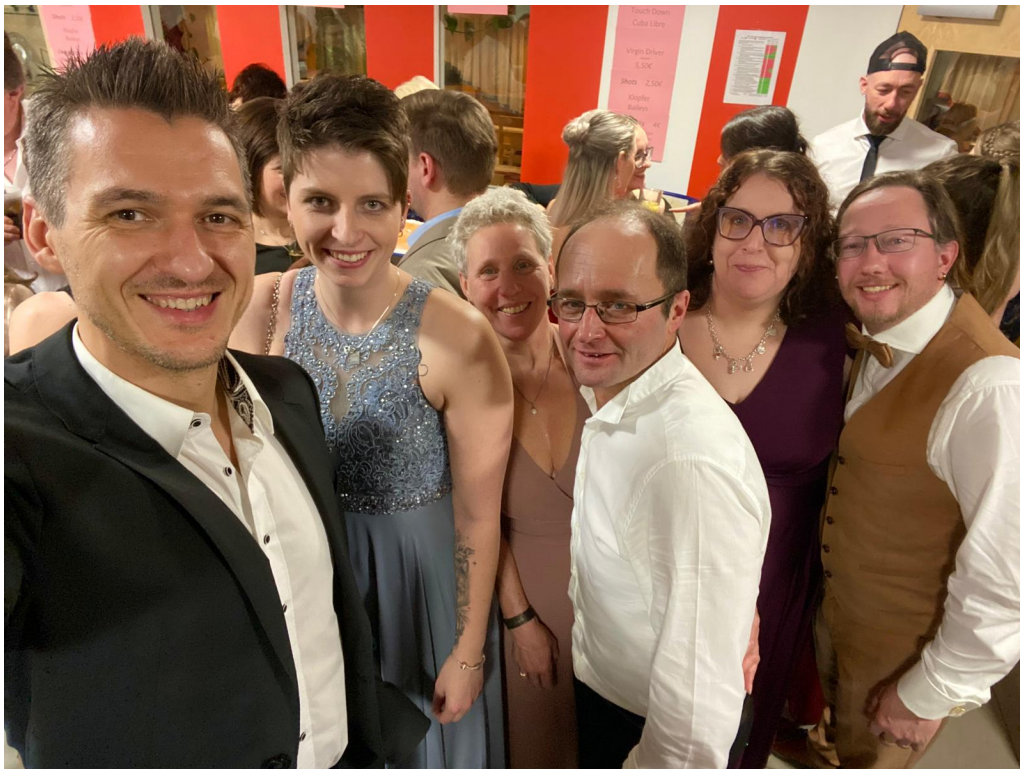
Unser Team bei Let's dance