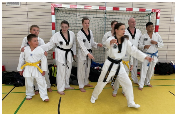
„schnell zum Foto mit den Meistern, bevor sie sich verziehen!“