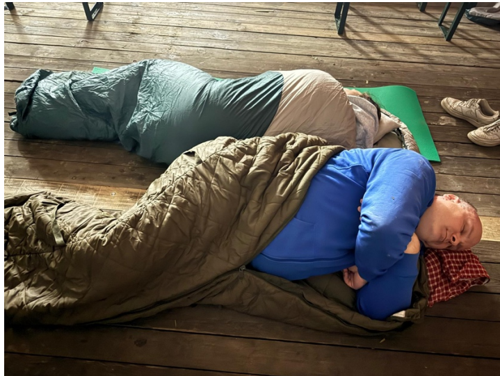
Wache halten!!!! Nicht schlafen ihr Luschen!