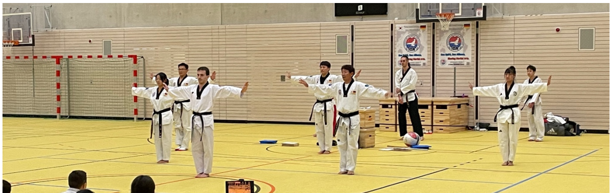
Jetzt zeigen wir euch mal, wie das wirklich geht!!! Demo der Trainer