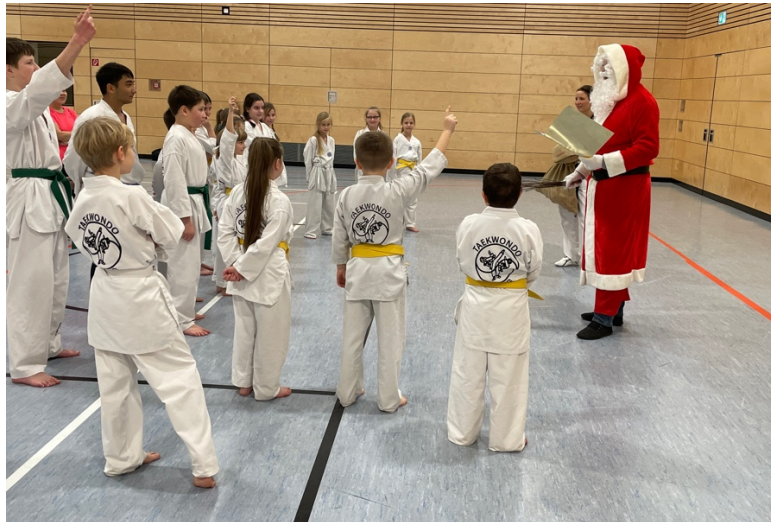
Wer hat eine Nussallergie???