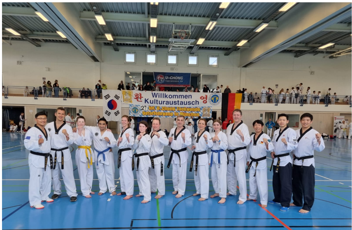
Gruppenfoto mit den Trainern