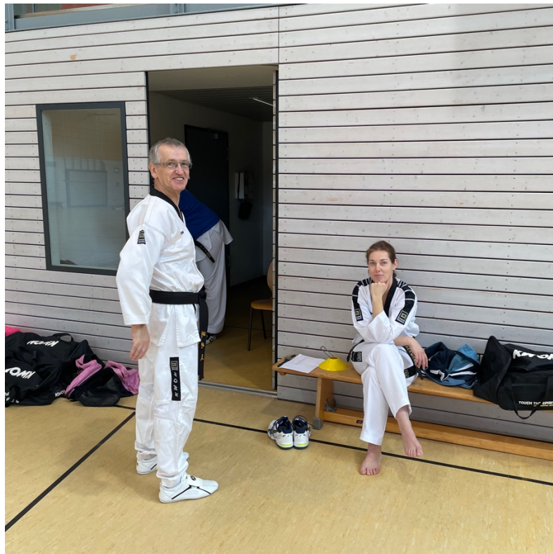
Also, die waren eigentlich ganz nett und nicht schlecht