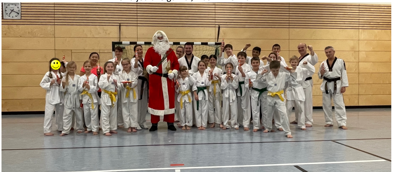
Der Große mit dem roten Mantel könnte Andi sein!!!