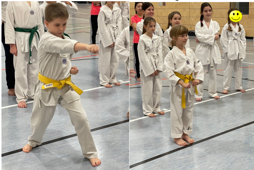
Und jetzt zeigt mal, was ihr könnt