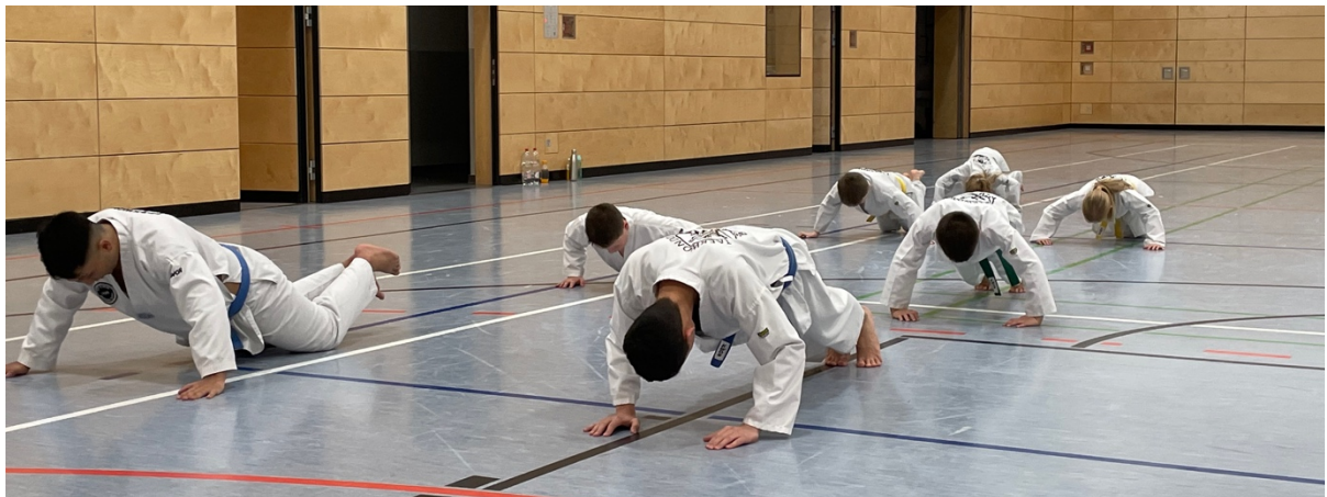
Diese TKD-Grundübung – muss jeder beherrschen