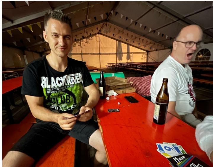
Noch ein letztes Bierchen und dann ab in den Schlafsack