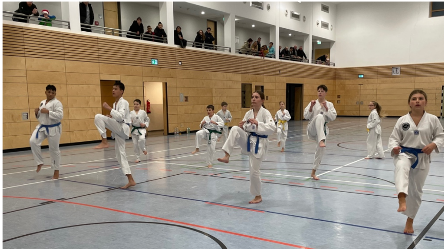
Sieht noch etwas müde aus