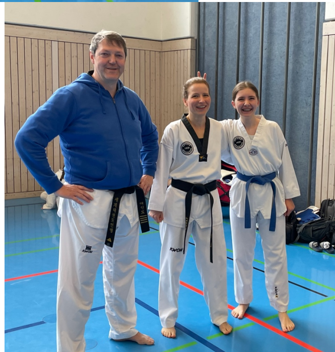
Die Früchte der antiautoritären Erziehung