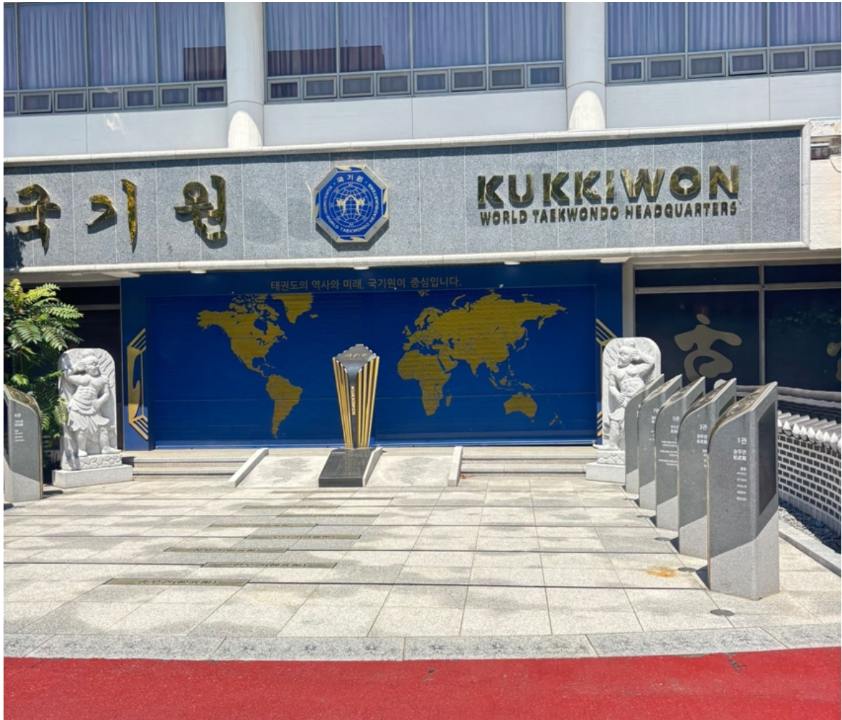
Sozusagen der Vatikan des Taekwondo