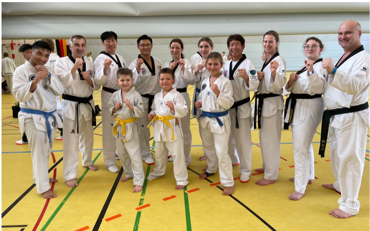
Gruppenfoto mir einigen der Großmeister