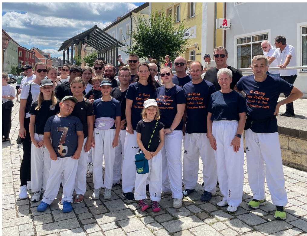
Festeinzug am 28. Juni