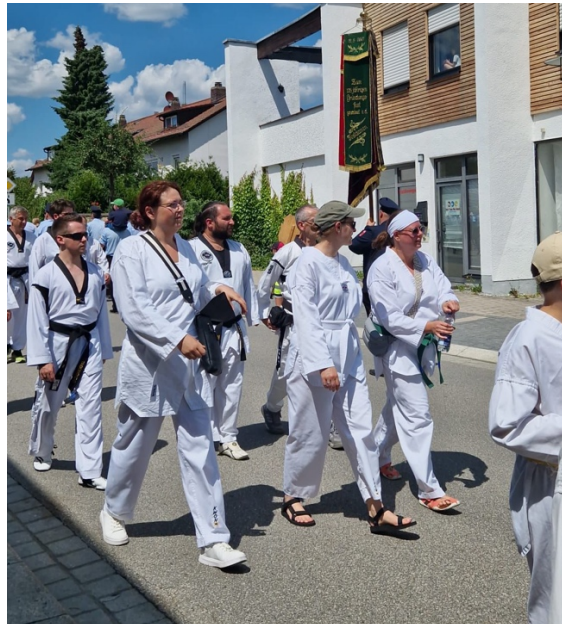
Nichts geht über eine kleine Runde durch den Markt