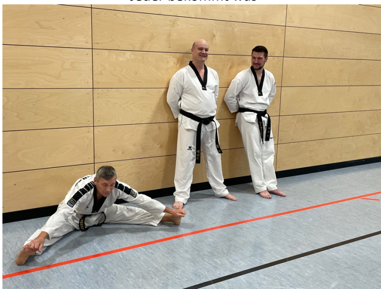
Von wegen – Die Danträger gehen mal wieder leer aus