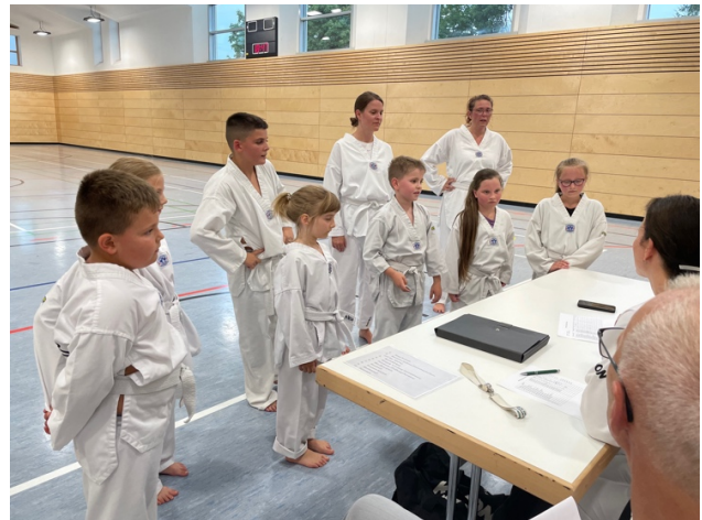
Immer diese blöden Fragen