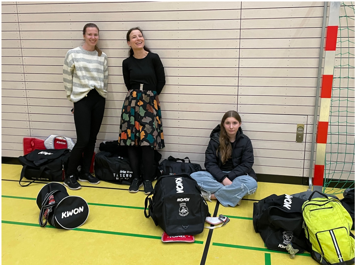
Von wegen mental Durchgehen – nach dem Essen schläft der immer