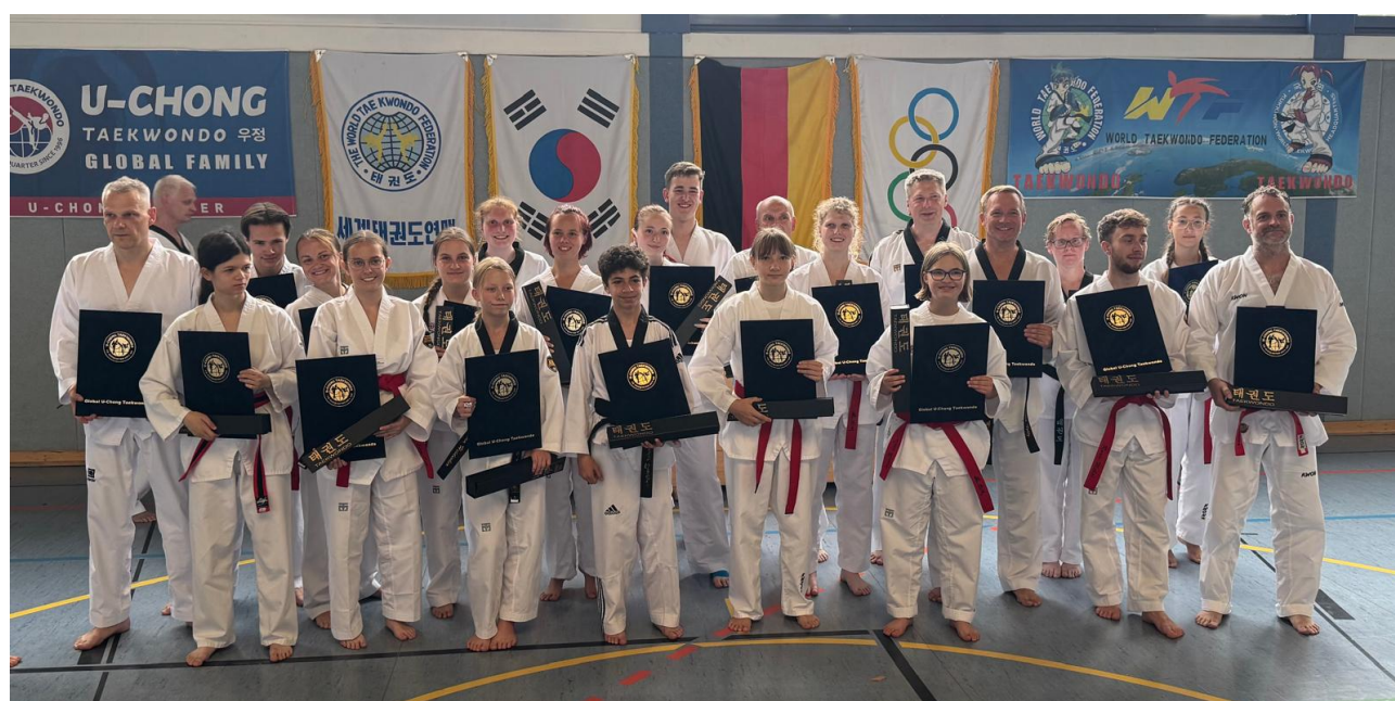
Gruppenfoto nach bestandener Prüfung – wir gratulieren!