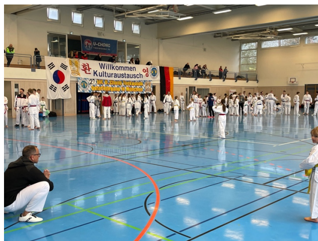
Es geht nicht über ein vertrautes Terrain