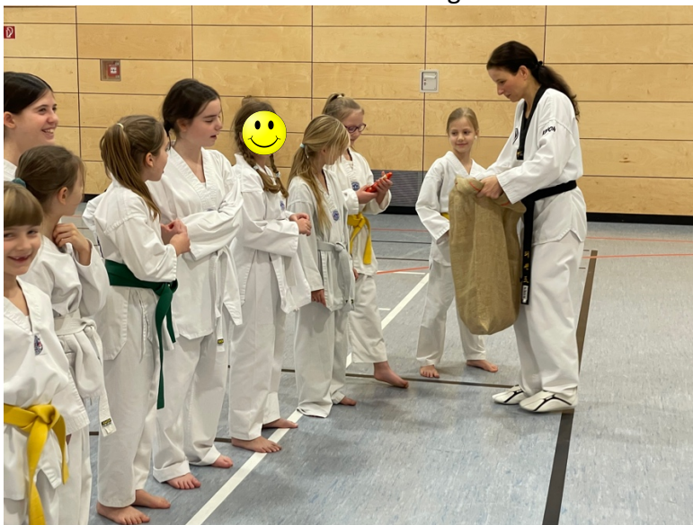
Jeder bekommt was