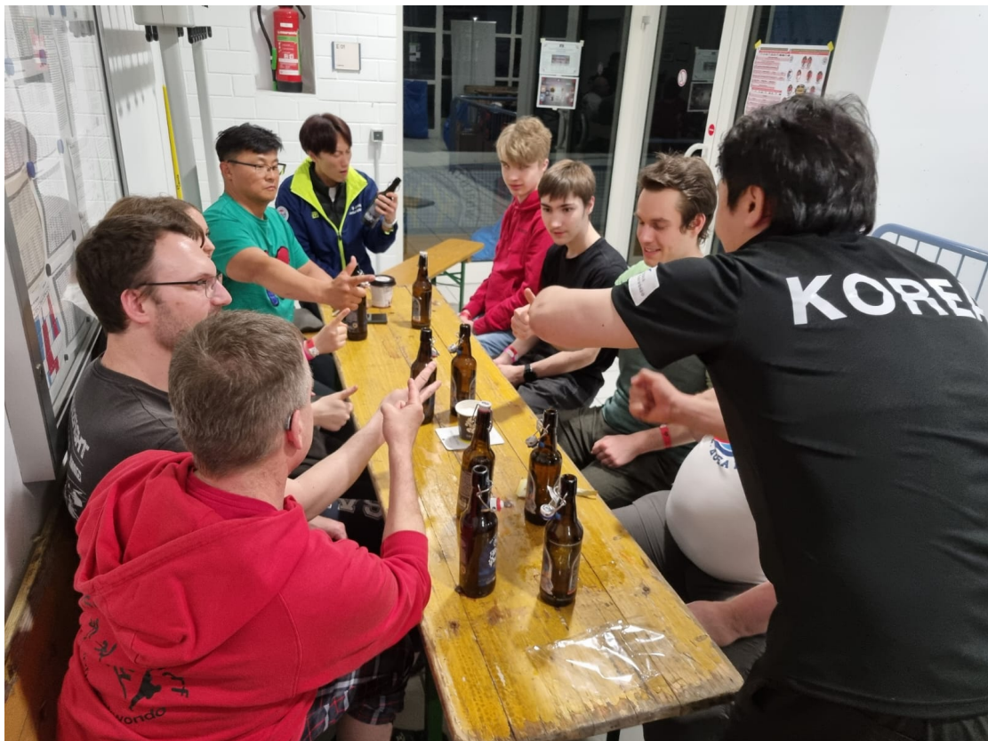
Und ein 4. Dan scheut auch nicht den direkten Kampf mit Großmeister Moon (7.Dan)