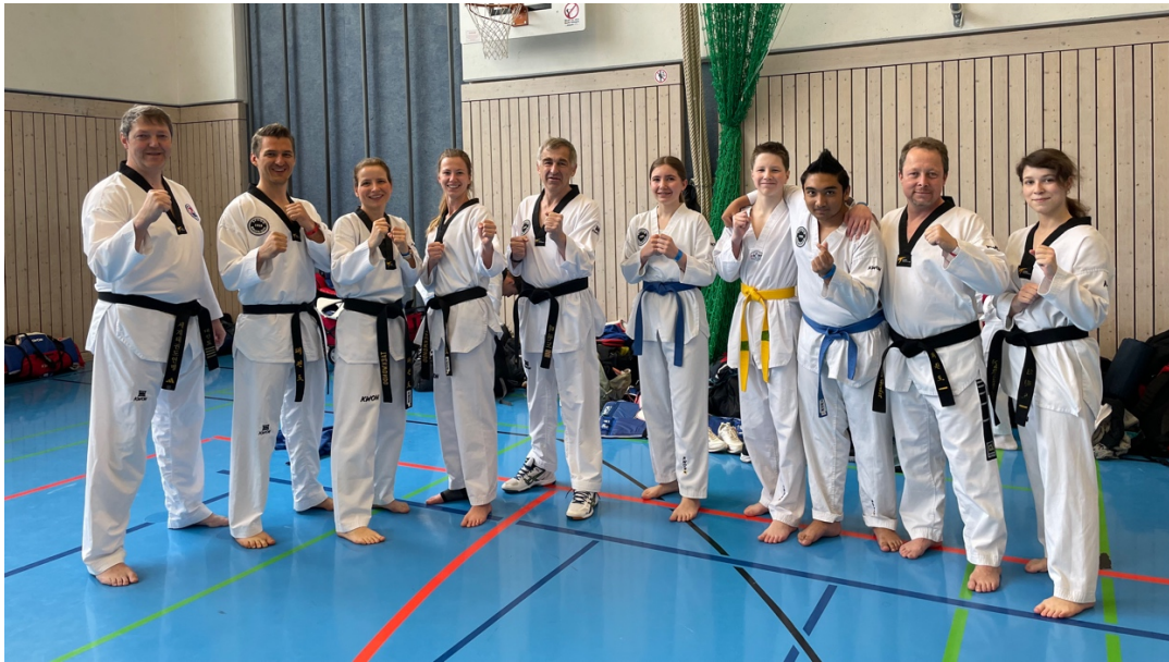
Noch sind wir gut drauf – und unverletzt