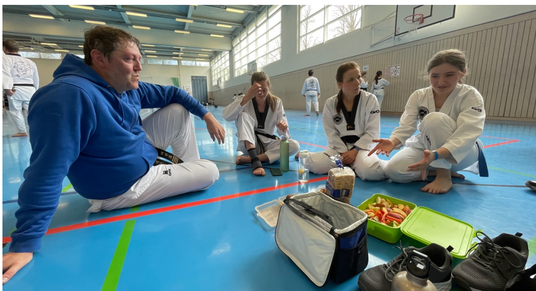
Ein paar Kalorien vor dem Training können ja nicht schaden