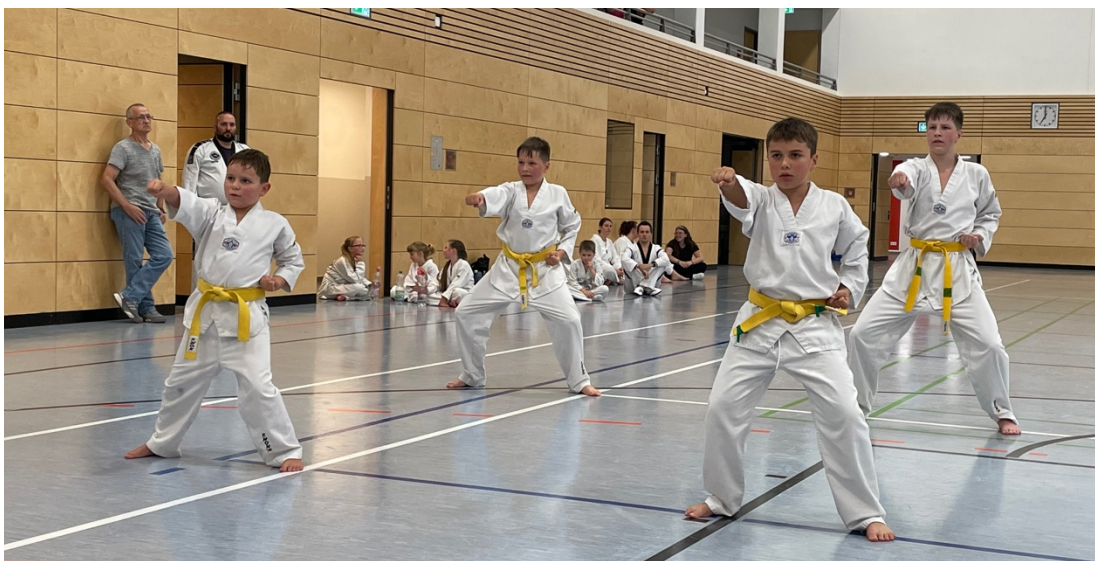
Die Jungs wirken voll entschlossen